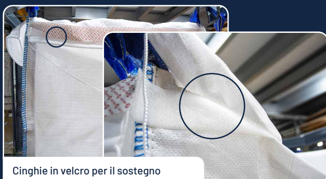
Cinghie in velcro per il sostegno

È possibile aggiungere/inserire un sacchetto di feltro in polipropilene all'interno del filtro big bag (SI18133). Questo feltro migliora la permeabilità, riduce l'intasamento e offre soglie di filtrazione più basse (da 1 a 200 µm). Il sacco deve essere supportato meccanicamente dal filtro big bag SI18133. I lacci facilitano la legatura del sacco attorno al filtro big bag.