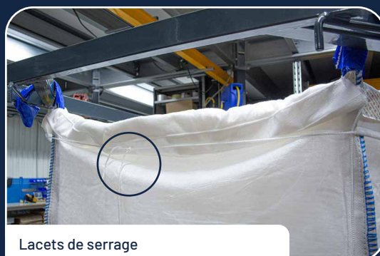
Lacets de serrage