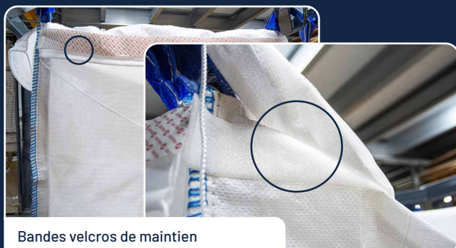
Bandes velcros de maintien

Il est possible d'ajouter/insérer à l'intérieur du big bag filtrant (SI18133) un sac en feutrine polypropylène. Cette feutrine améliore la perméabilité, réduit le colmatage et offre des seuils de filtration inférieurs (de 1 à 200 µm). Il est impératif de supporter le sac mécaniquement par le big bag filtrant SI18133. Les lacets permettent de sangler facilement le sac autour du big bag filtrant.