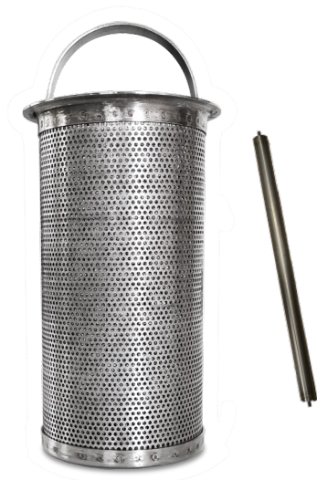
Ensemble bougie magnétique et panier plissé